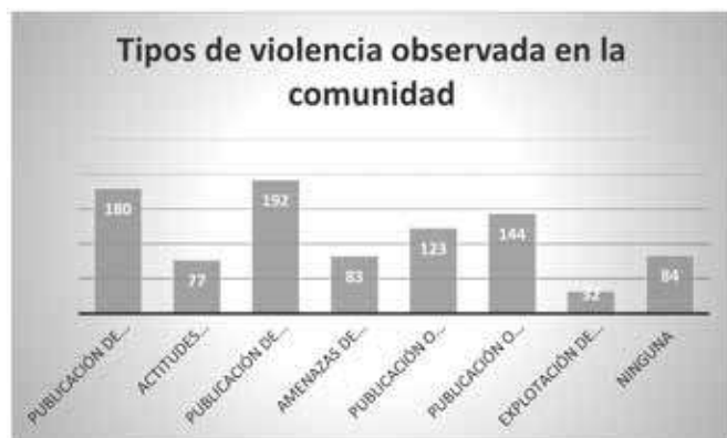
Gráfica 2. Tipo de violencia observada en el rango de edad estudiado en el Municipio de Huixquilucan, Estado de México en 2017.

Trescientas cuarenta y ocho personas encuestadas, lo cual representa el 90% de la muestra considera que las redes sociales permiten la difusión y propagación de algún tipo de violencia, siendo Facebook considerada por el 63.9% de las y los participantes como la plataforma que más propicia dichas actitudes y Twitter ocupando el segundo lugar con el 17.7% (Gráfica 3). Además, el 68.7% piensa que la violencia